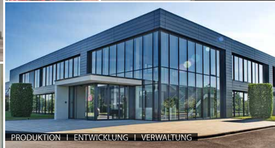
PRODUKTION | ENTWICKLUNG | VERWALTUNG